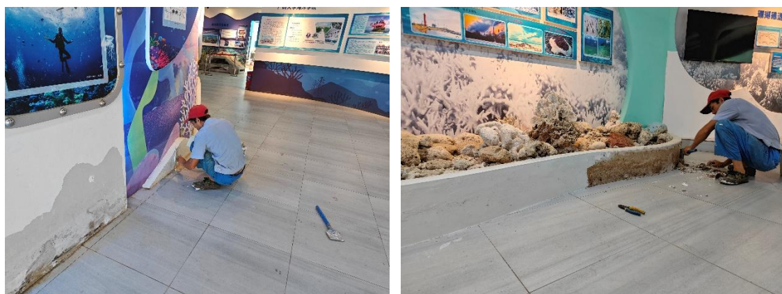
瓦工师傅正在修复破损墙面

2026年4月，工作人员累计对海底管道及潜水泵进行巡查3次，并对各缸体循环水泵运行情况及其出水量进行检查，及时修复破损叶轮1个，保障循环水系统稳定运行。此外，本月更换可视化监控系统超窄边拼接屏1块，并对场馆内多处破损墙面进行修复，进一步提升场馆整体环境质量。