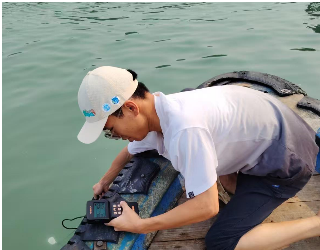
工作人员正在采集自然海域光照数据