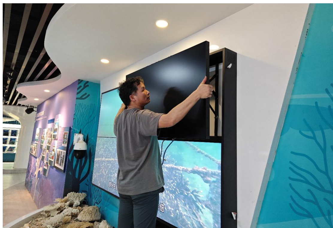
师傅正在更换超窄边拼接屏