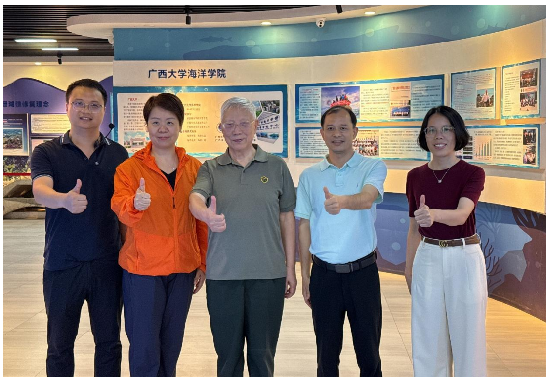
4月14日 中国工程院院士王景全莅临本馆参观交流

2026年4月，中国工程院院士，中国人民解放军陆军工程大学教授王景全及专家团队一行、米兰理工大学、西安交通大学、武汉大学、南方科技大学等莅临本馆考察交流。