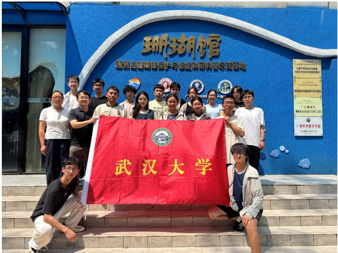
4月26日 武汉大学一行来馆参观交流