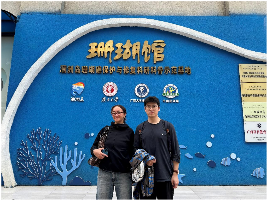
4月23日 米兰理工大学一行来馆参观交流