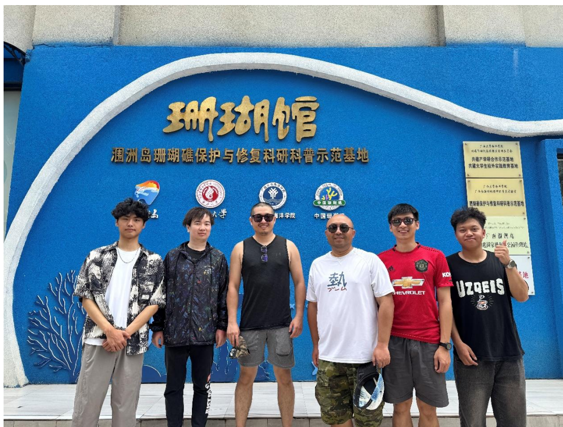
4月28日 南方科技大学一行来馆参观交流