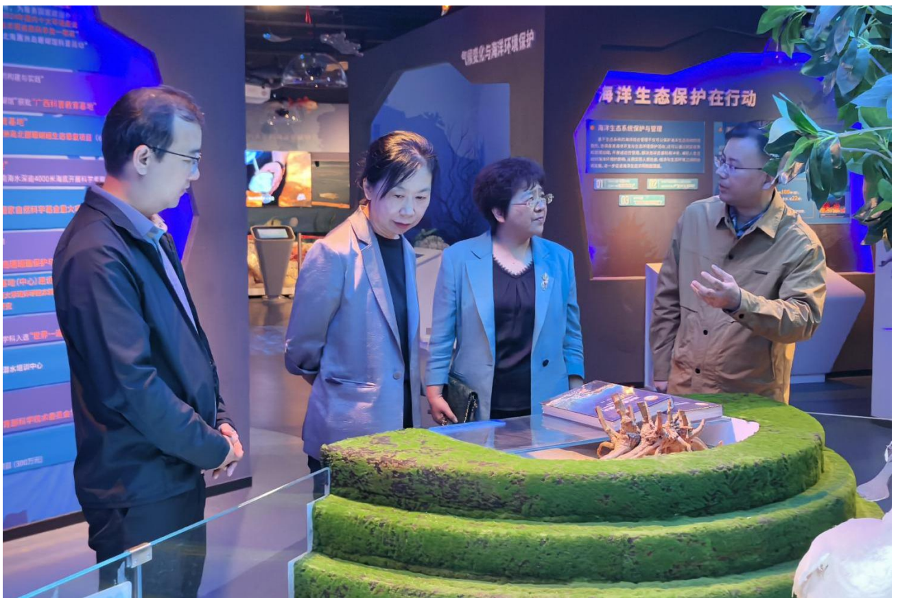
3月23日 海南省人力资源开发局党组书记、局长赵微一行来访