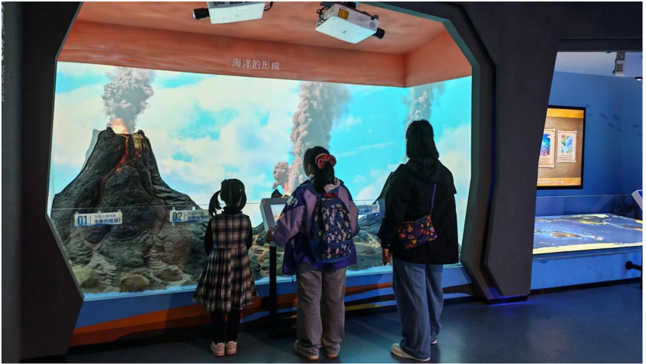
3月7日 场馆科普开放日