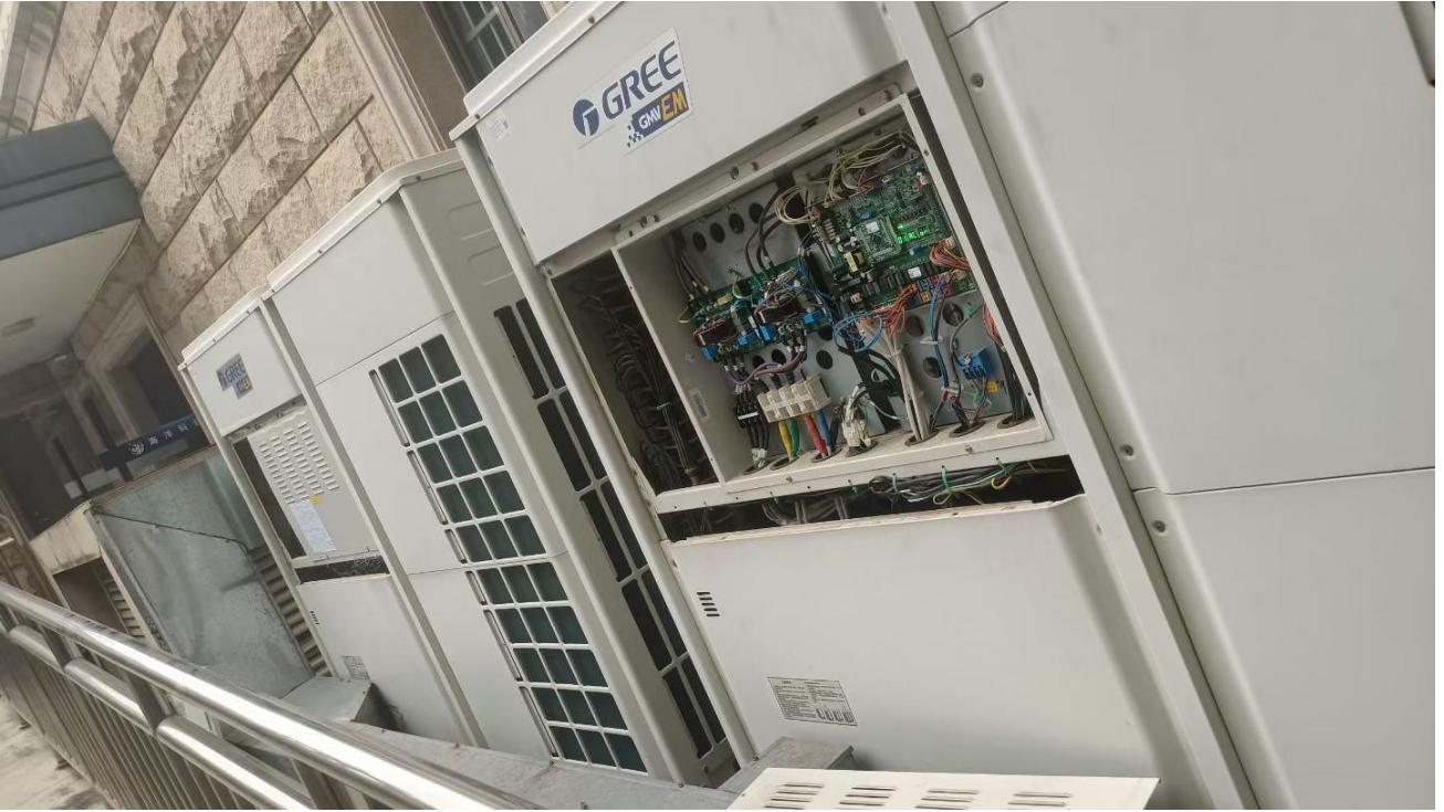
空调新风系统维修