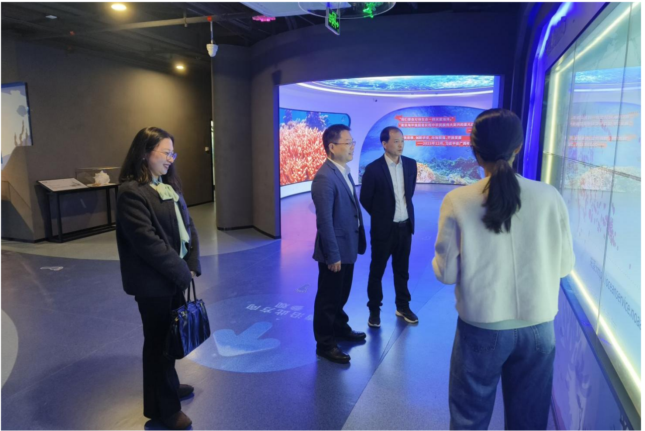
3月4日 玉林市委常委、副市长张海鹏来访