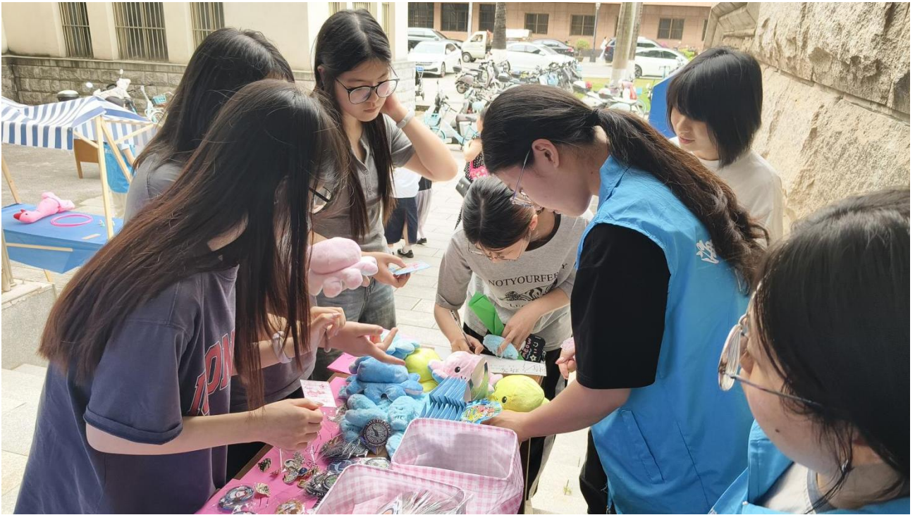
3月28日 “心海杨帆，善爱自我” 325心理健康游园会活动