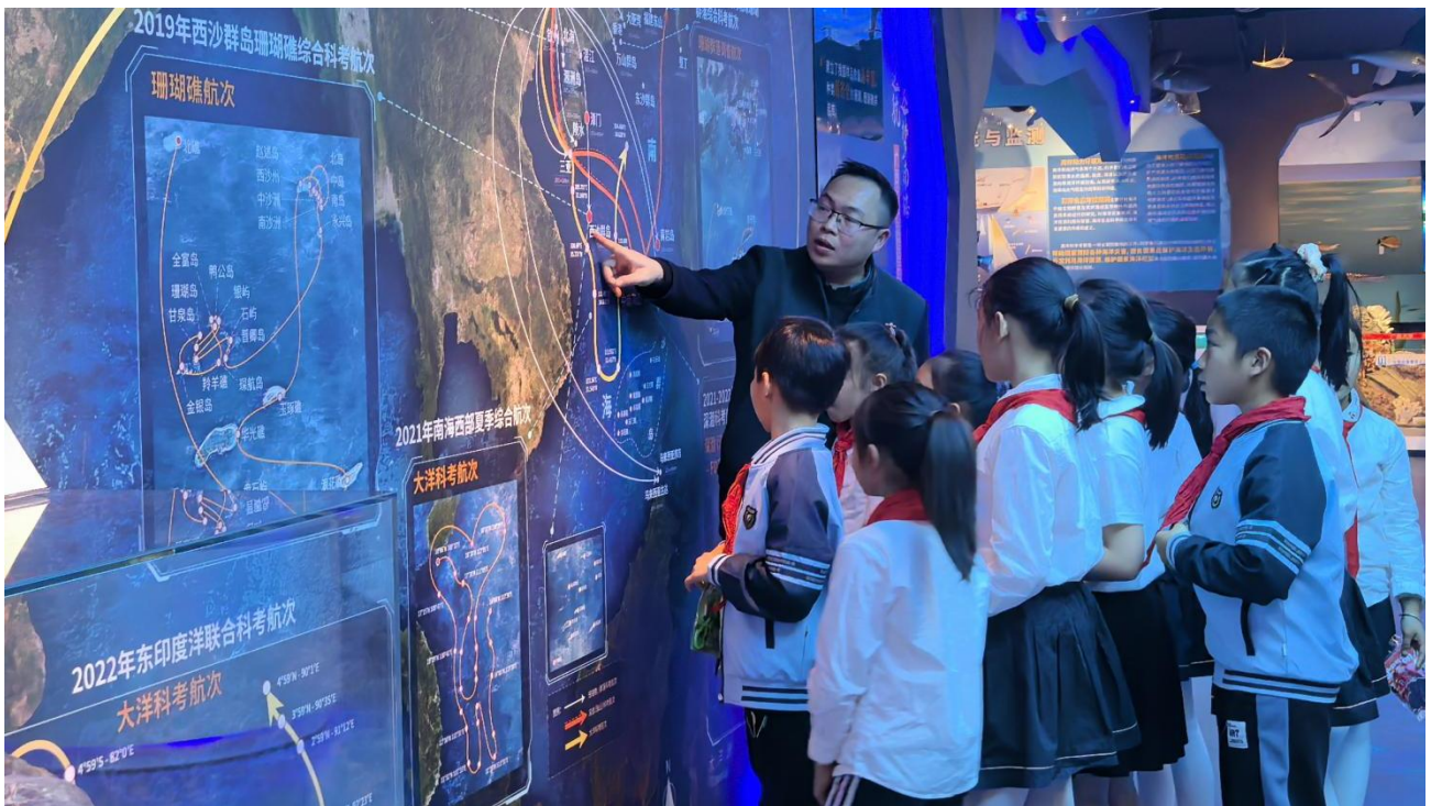
3月11日广西大学附属学校学生参观