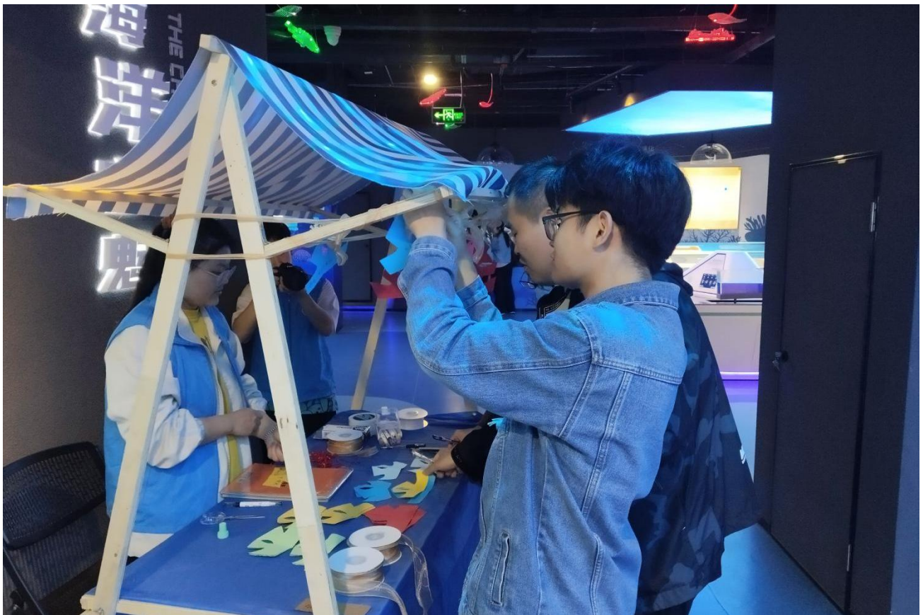
3月3日 “心海同行，向阳生长” 广西大学三月心理健康活动