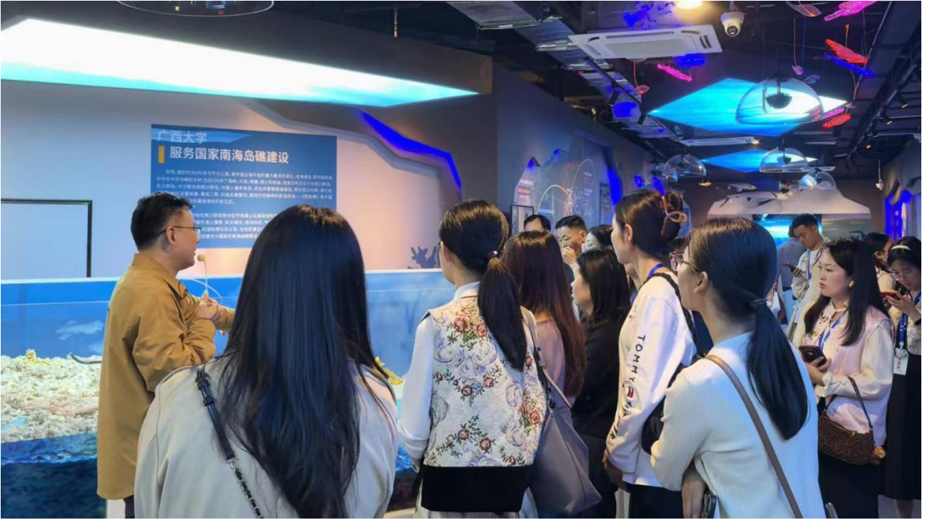
3月25日 2026年广西中学团校骨干教师、县级少先队总辅导员、工作者培训班成员来访