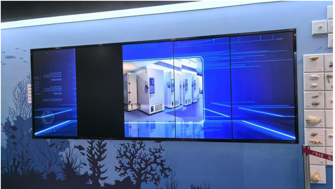
多媒体屏幕黑屏处理