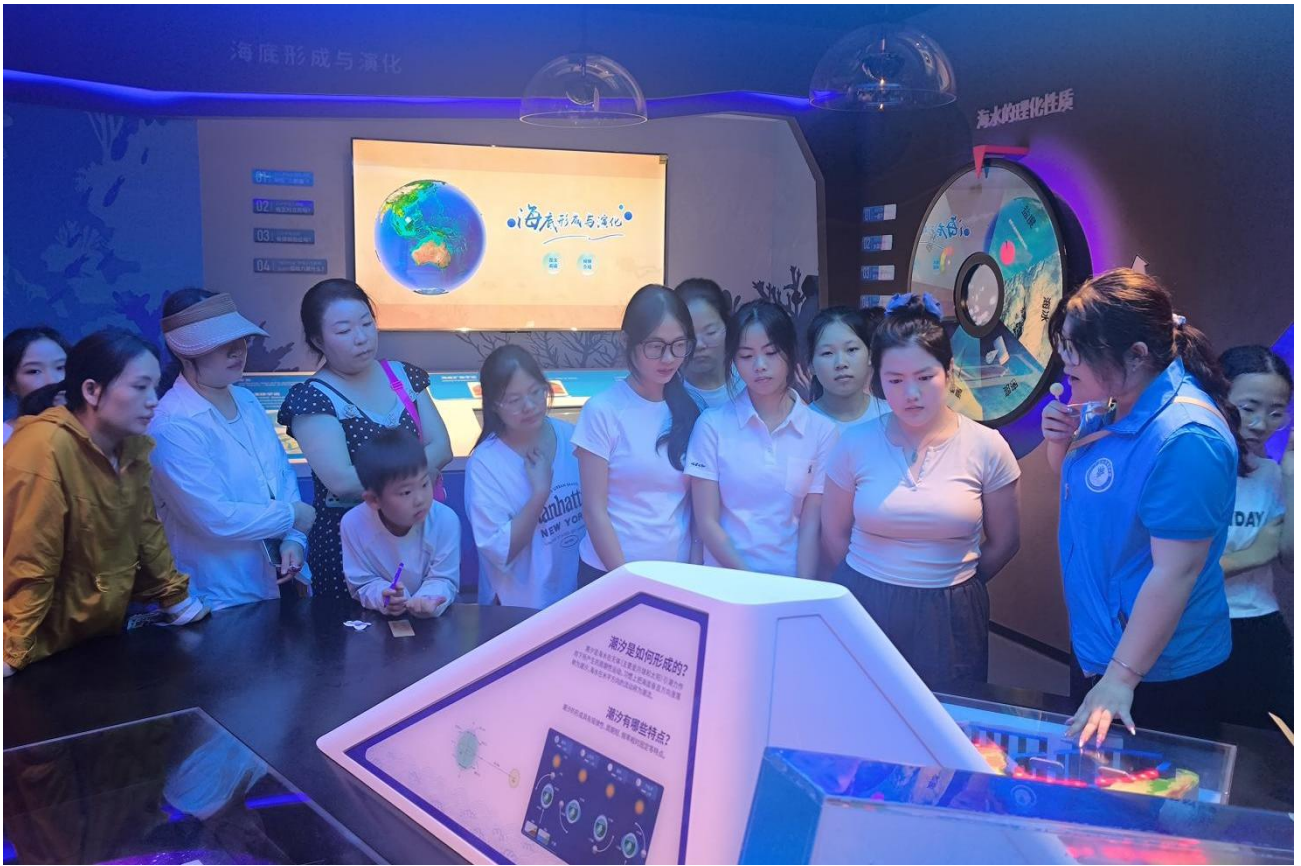
3月28日 广西卫生职业技术学院来访