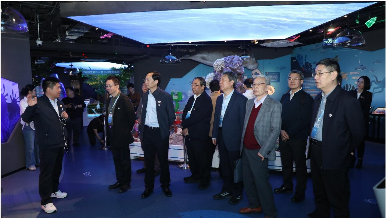
11月24日 中国科协2025年高层次人才国情考察活动（广西）院士团一行来访