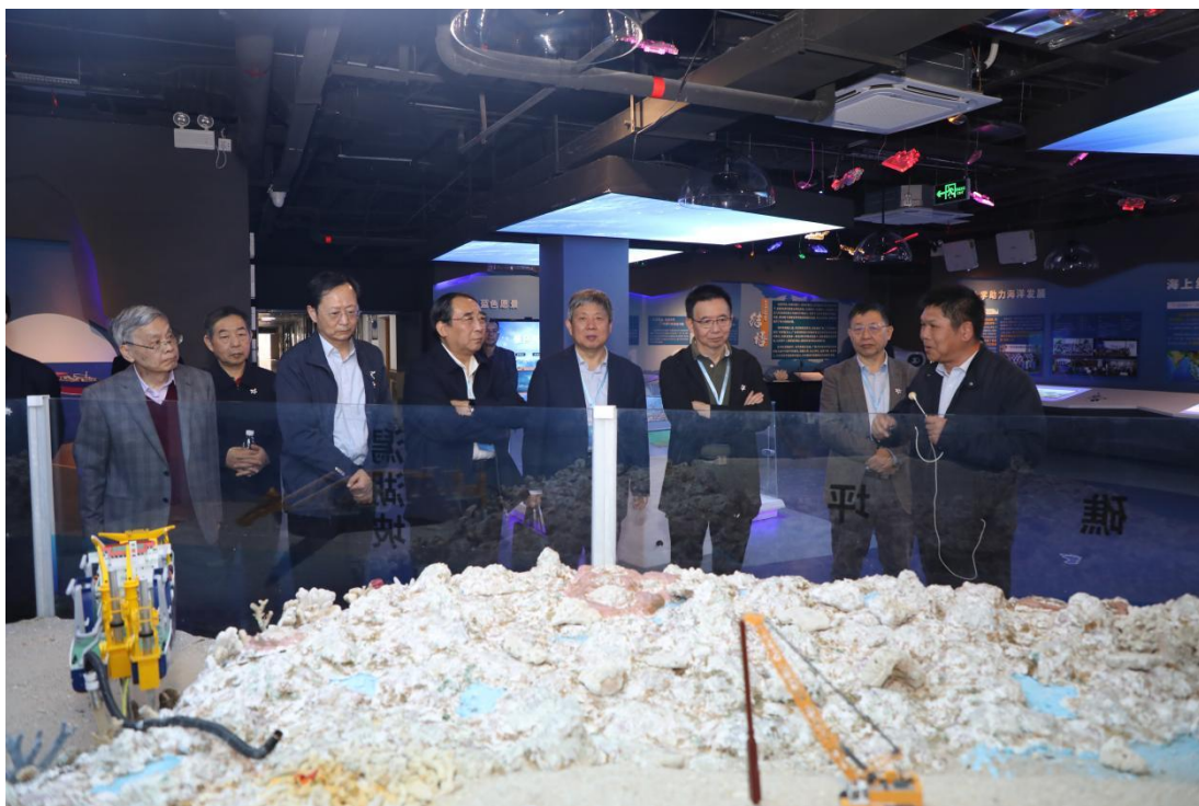
11月24日 中国科协2025年高层次人才国情考察活动（广西）院士团一行 来访