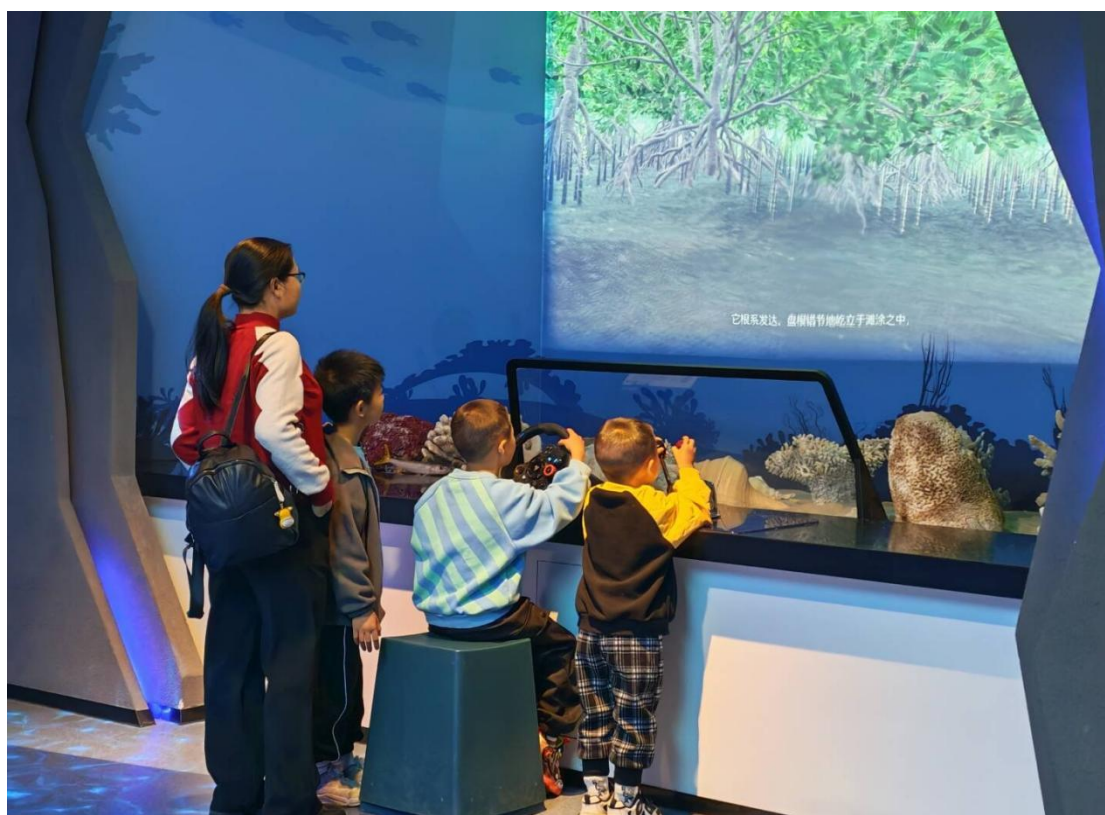
11月22日 场馆科普开放日