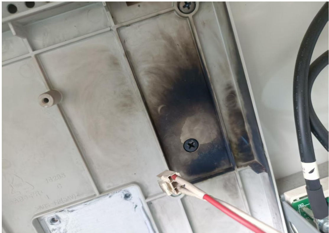
空调变频模块烧毁故障处理