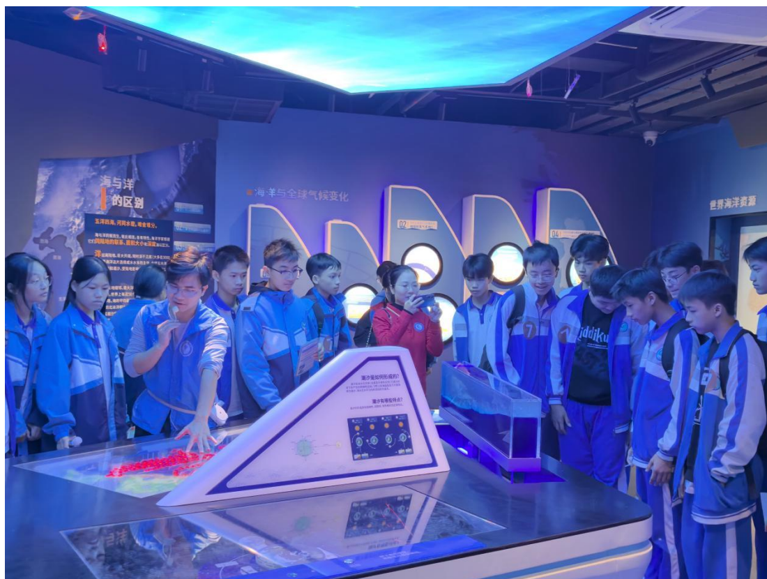
11月27日 防城港市光坡中学学生研学