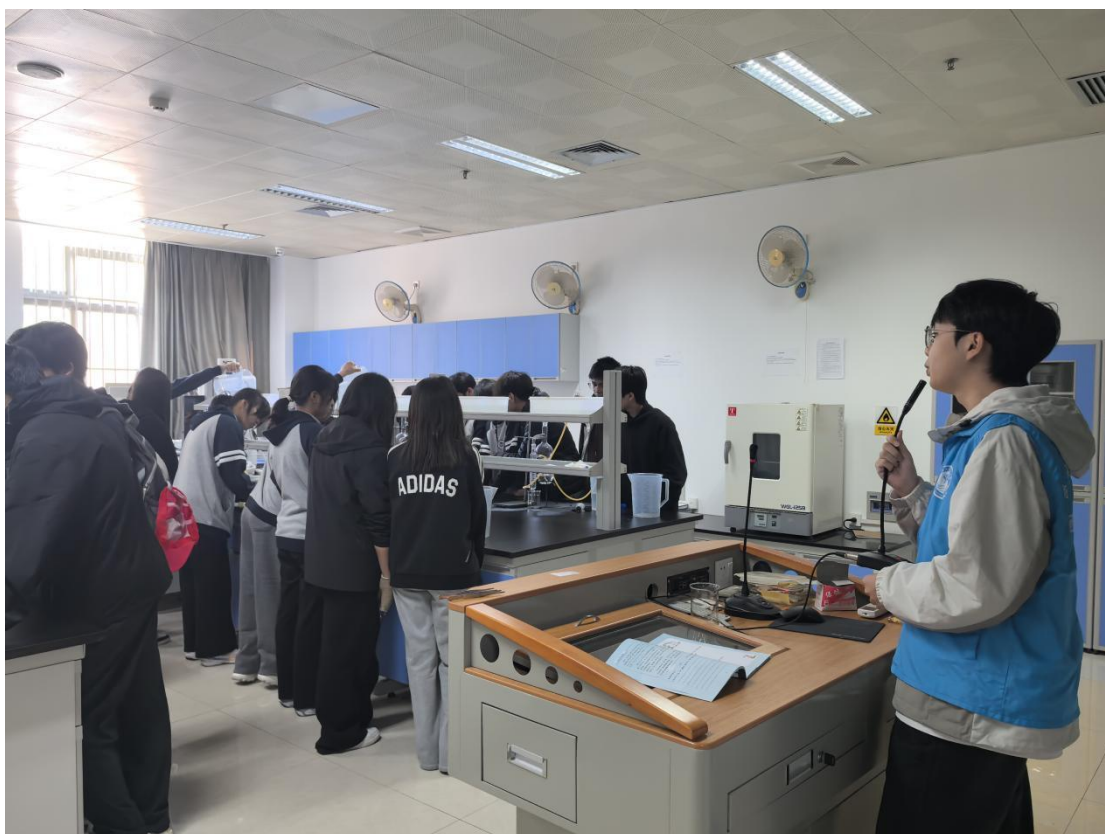
11月21日 武鸣区博雅学校学生研学