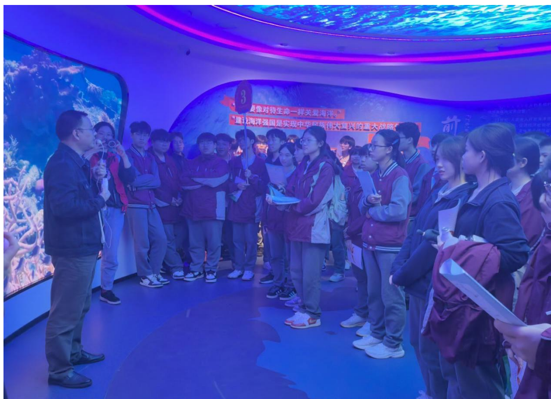
11 月 10 日 来宾市培文学校学生研学

2025 年 11 月，接待研学活动 13 次，参与人数 4369 人。广西科学技术普及传播中心、南宁市玉兰路小学、来宾市培文学校、南宁市龙岗小学、防城港市金湾中学、防城港市光坡中学来馆研学。