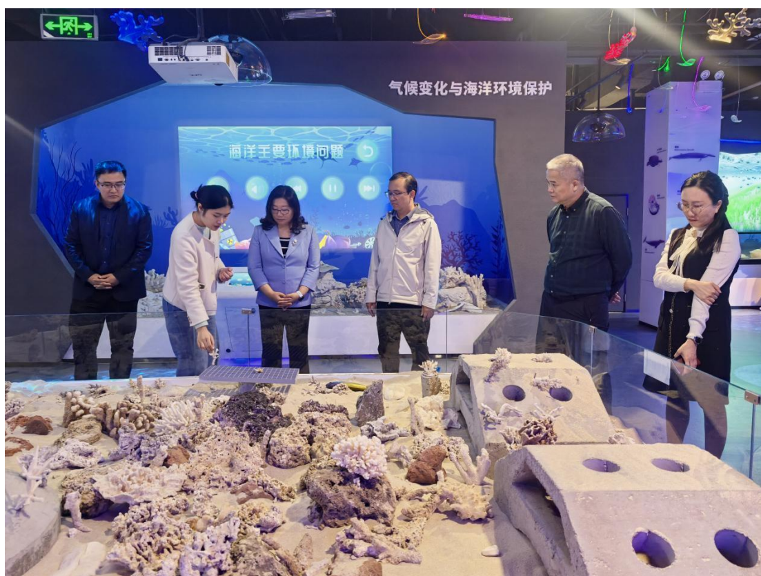
11月30日 北京航空航天大学党委常委、副校长邓怡一行来访