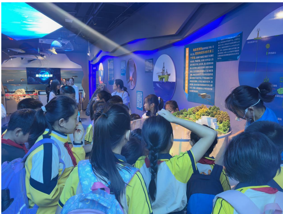
11月12日 南宁市龙岗小学学生研学