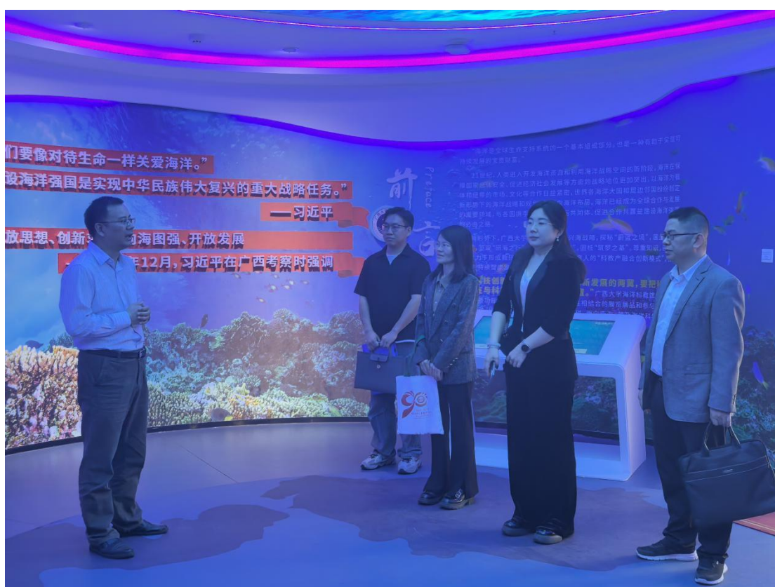
11月17日 桂林医科大学团委来访