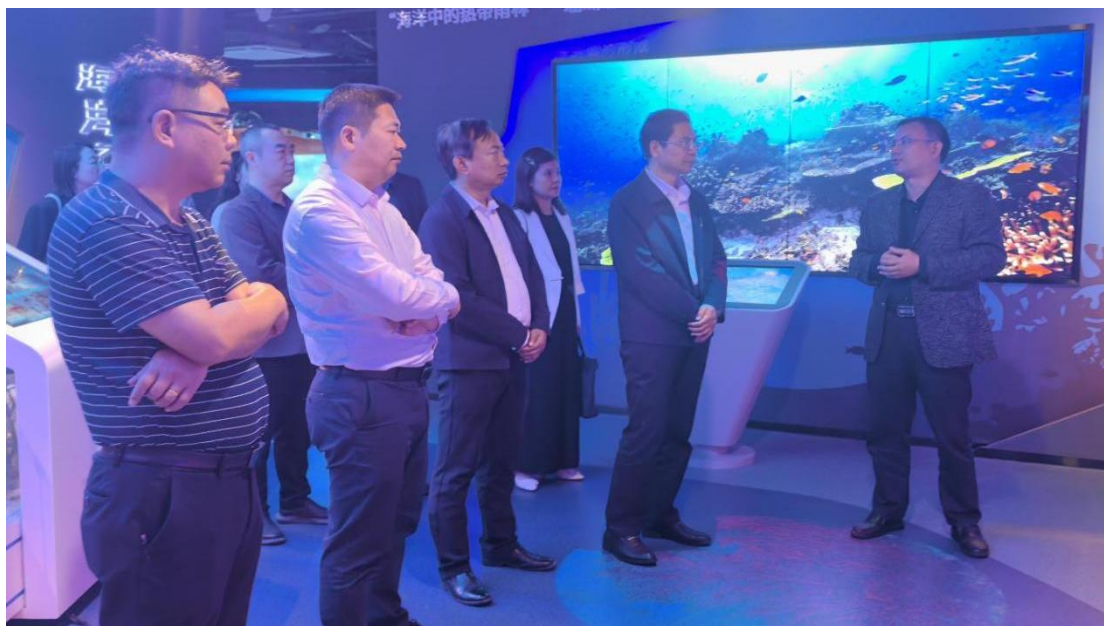
11月12日 岭南师范学院来访