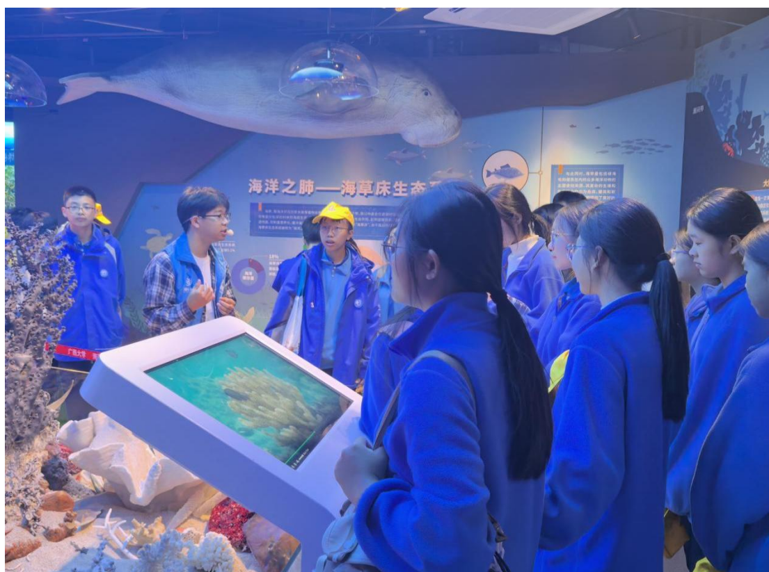
11月20日 防城港市金湾中学学生研学