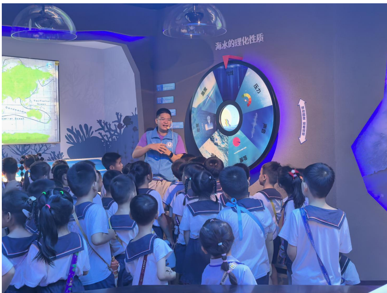
5月20日 南宁市江南区广幼稚慧西园幼儿园研学