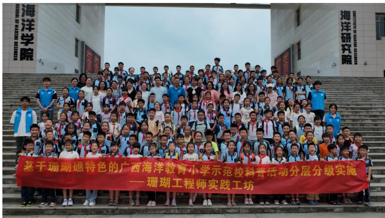
5月19日南宁市金阳路小学来访