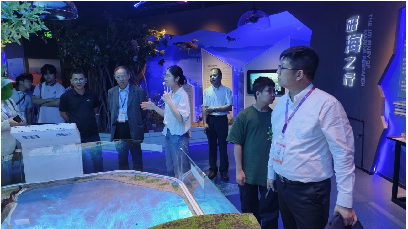
5月27日 香港国际青少年艺术及交流协会学生交流团来访