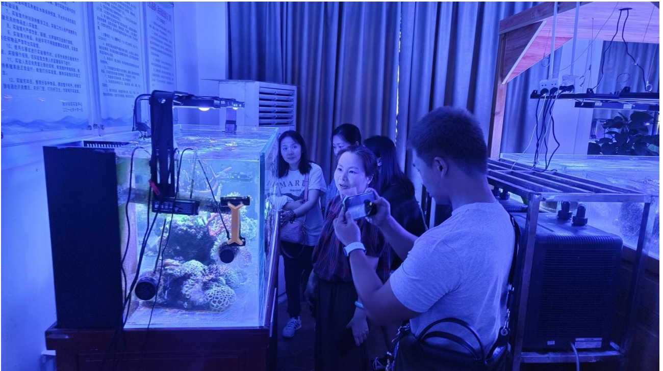
5月19日 接力出版社有限公司来访