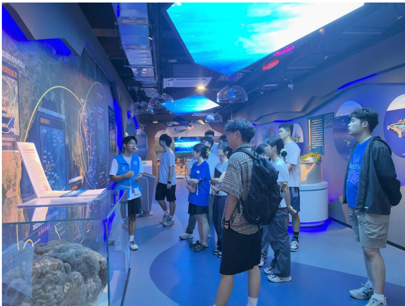
5月29日 广西大学化学化工学院研究生会来访