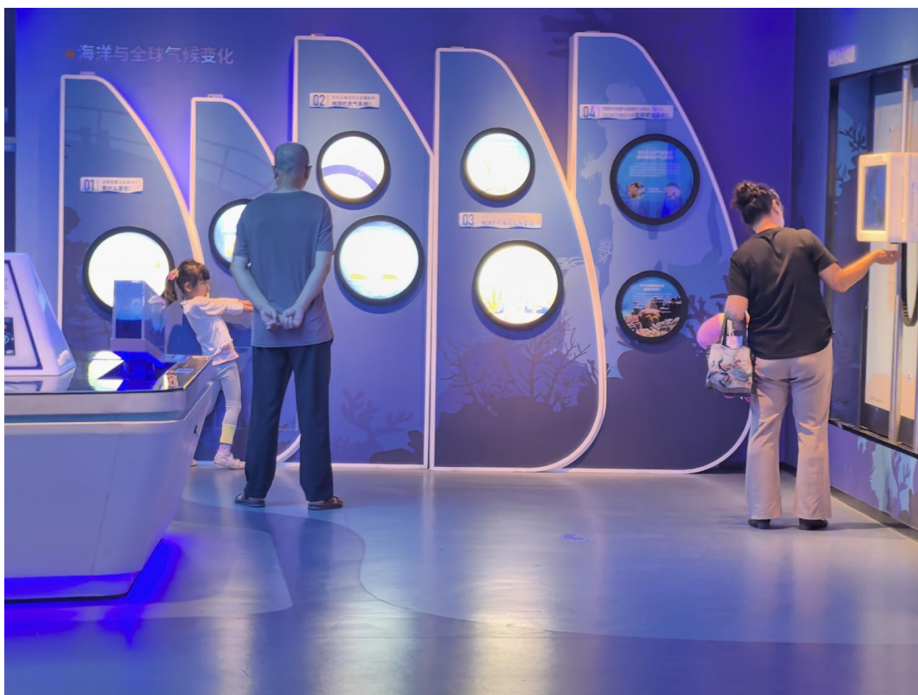
5月9日 场馆科普开放日