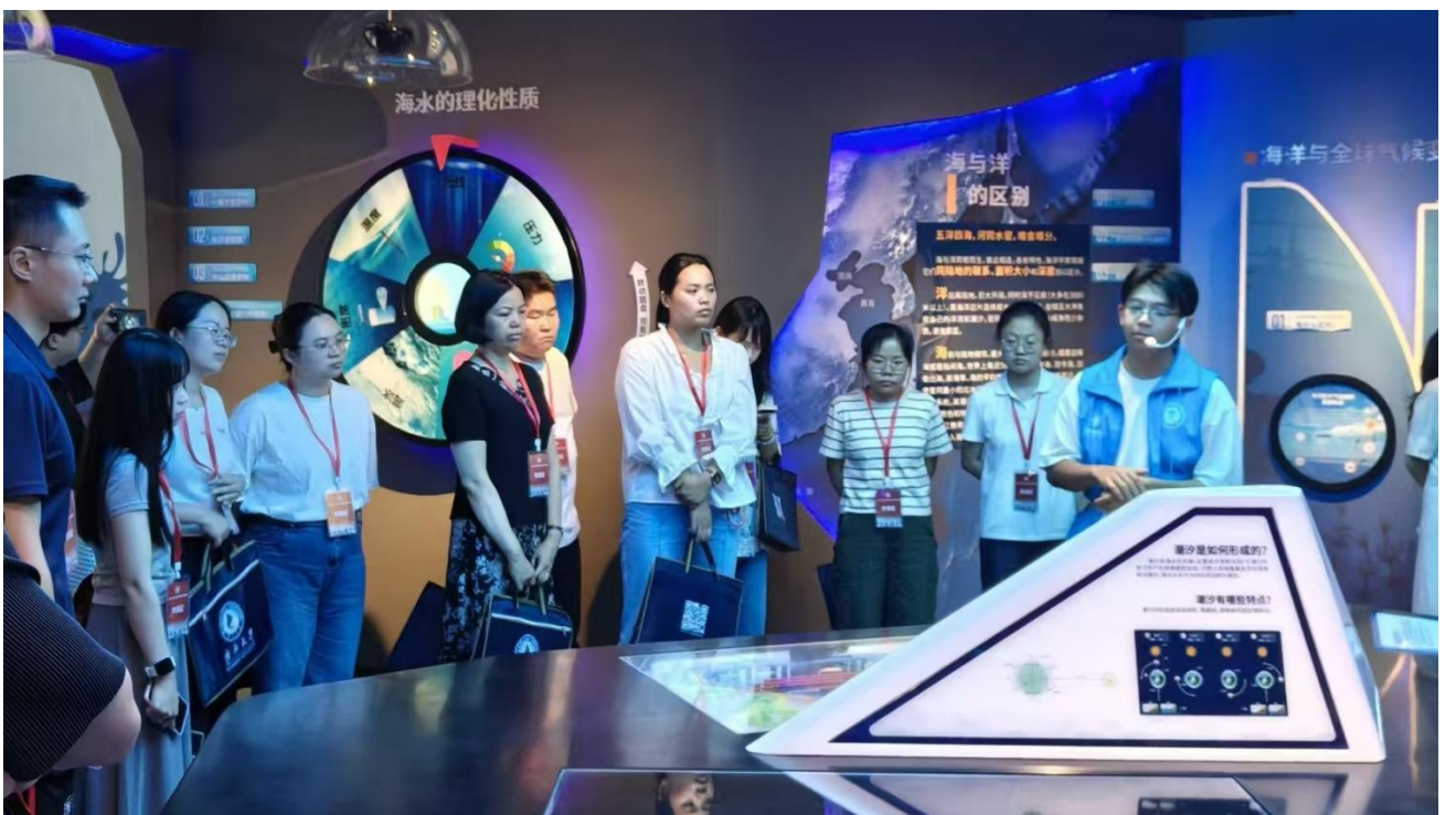
5月27日 2026年广西高校学生党支部书记示范培训班来访