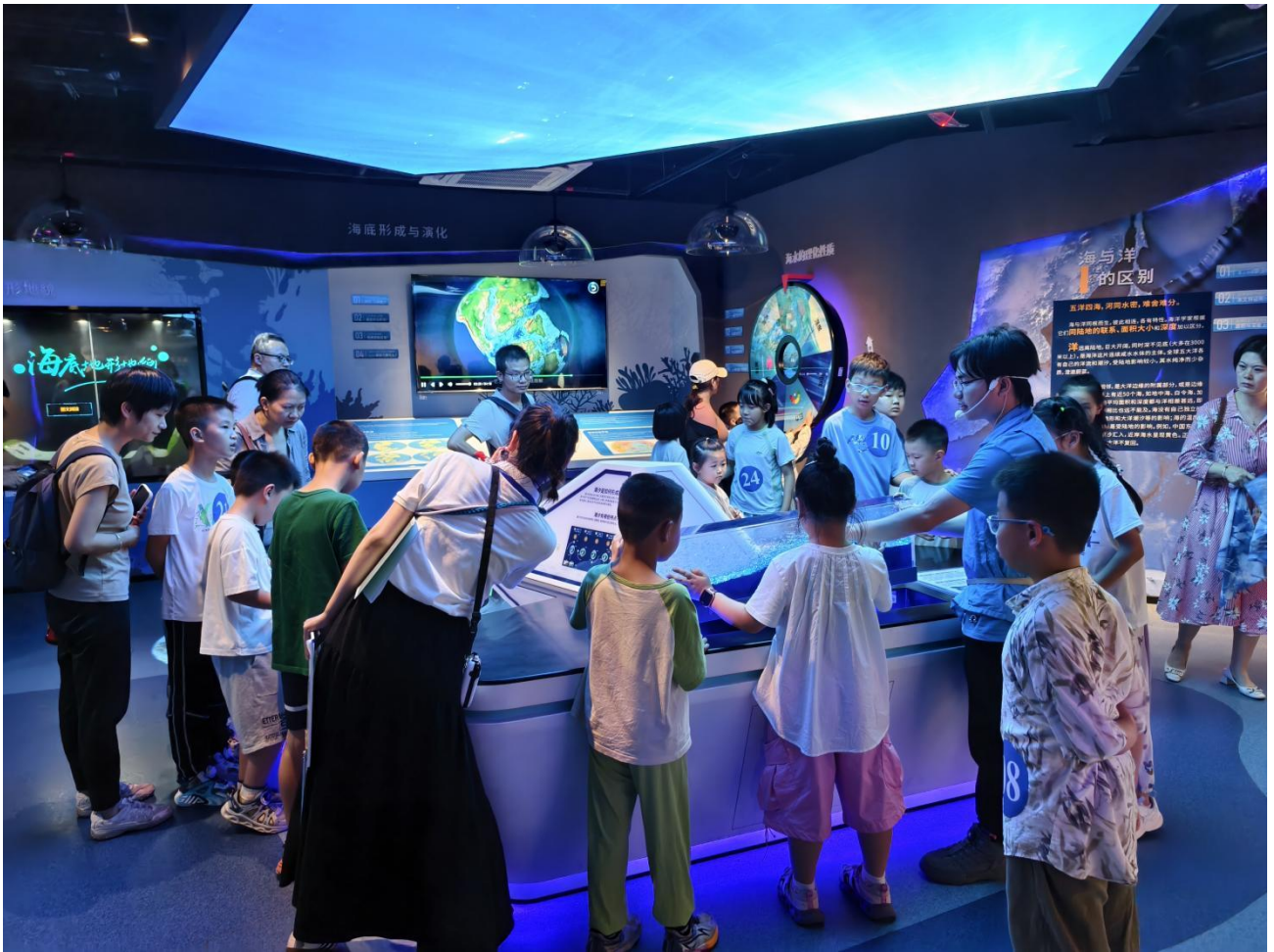
5月24日南宁市边防检查站的职工子女开展亲子研学