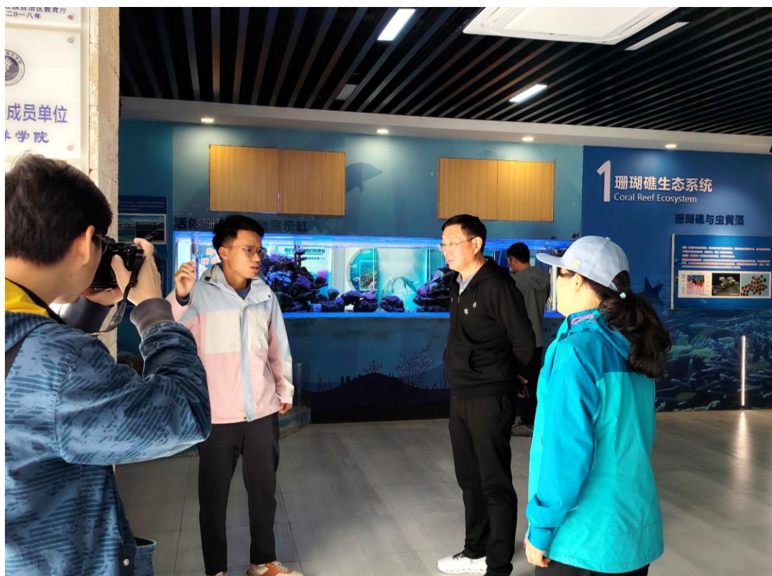
自治区科协陪同中国工程院张福成院士来馆考察