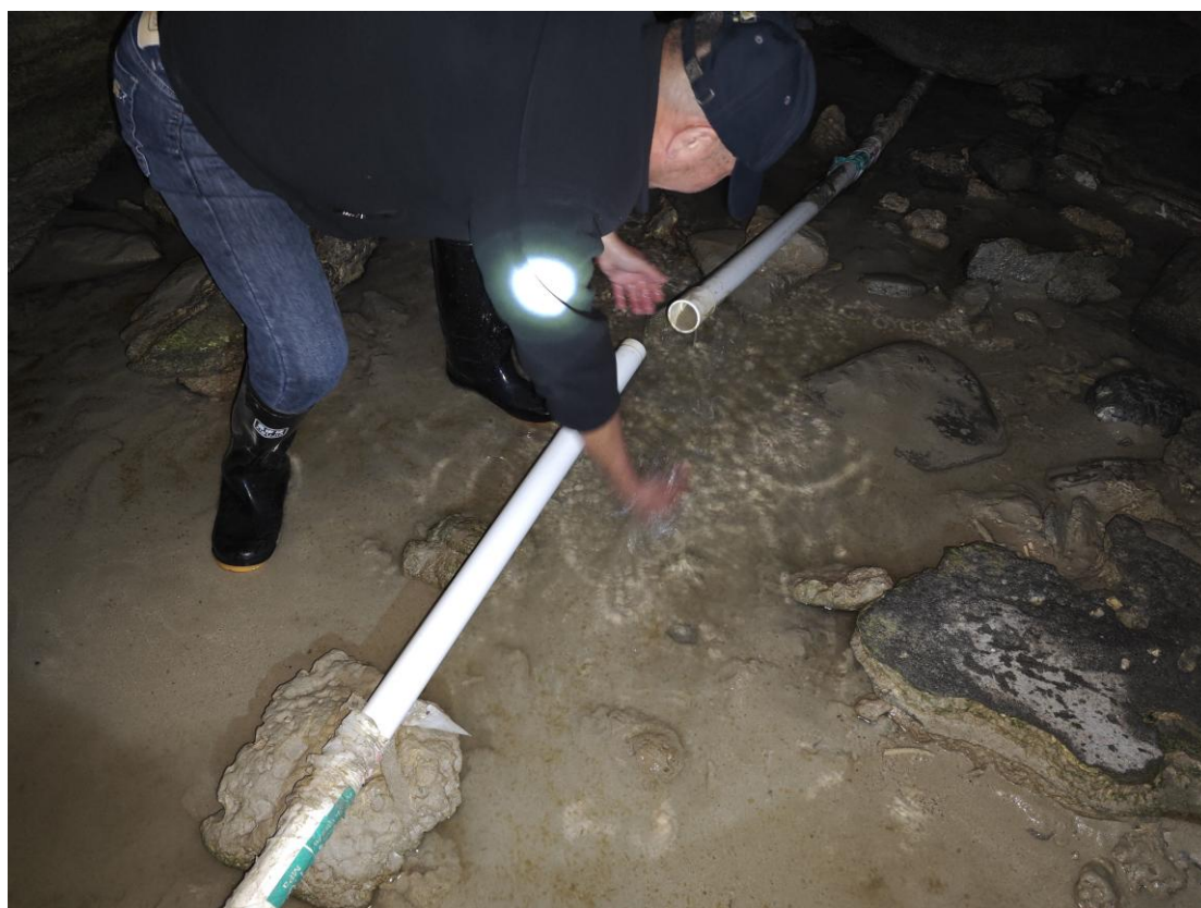
工作人员连夜抢修海底管道

2025 年 11 月，因线路维护等原因珊瑚馆停电 1 次，柴油发电机组工作正常，对珊瑚馆各类设备维护 2 次。其中包括更换场馆入口外侧因进水损坏的监控摄像头，重新连接断裂的海底管道。目前景区沙滩退化严重，今年填埋的管道已重新暴露在外，同时该区域水质不稳定，建议重新填埋管道，并增设过滤、吸附及消毒等预处理设施，进一步完善蓄水池，保障水质的稳定。