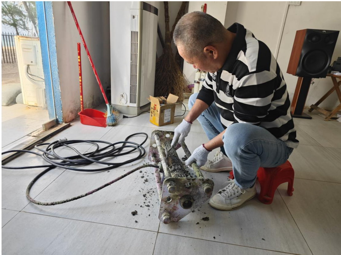
工作人员正在清理工程造浪上附着的藻类

2025 年 11 月，全月累计为珊瑚缸换水 6 次，针对珊瑚养殖缸附着红泥藻类与泥沙，开展 1 次清除作业，清洗蛋白分离器 1 次，确保珊瑚生长环境优良。给珊瑚喂食丰年虾 2 次，进行水质检测 3 次，检测指标均维持在合适的生长范围内。对两台工程造浪附着的藻类进行 1 次清理作业，维持设备工作状态稳定。