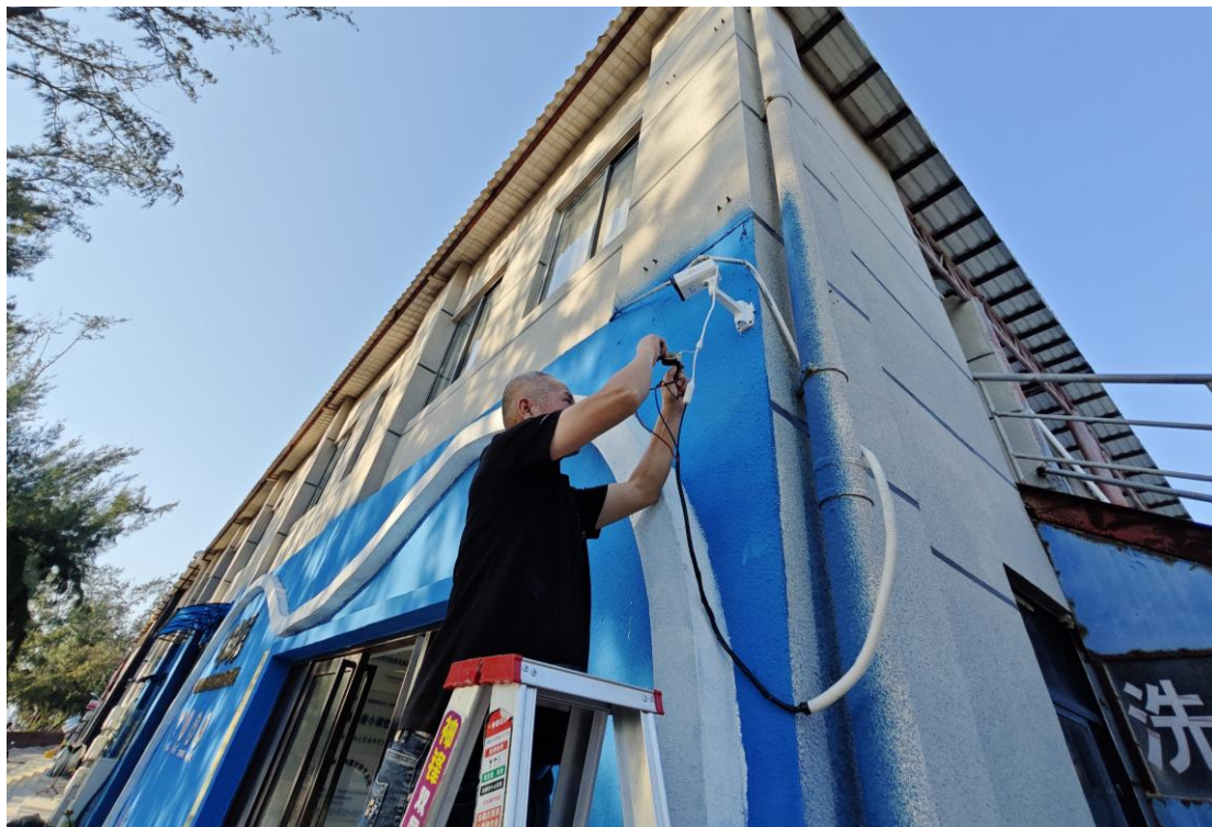
工作人员正在更换监控摄像头